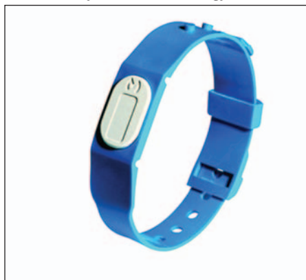
Armbånd med elektronisk chip.