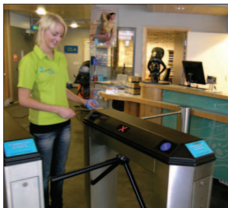
Rondellen sjekker billetten til gjestene.

til adgang til badet, låsing av garderobeskap eller for å handle i badets kafeteria og spa. Systemet gir samtidig en oversikt over antall brukere, og hvilke brukergrupper som igjen gir