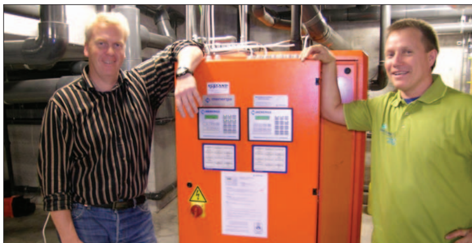
Daglig leder og teknisk sjef ved styretavlen til Menergas gråvannsgjenvinner.

Menerga har levert et spesialaggregat for gjenvinning av varme fra