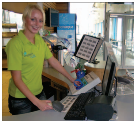
Billetteringen foregår enkelt med systemet.

Systemet er installert av Menerga AS og er et elektronisk billettering og salgssystem hvor alle besøkende får armbånd med chip som kan brukes