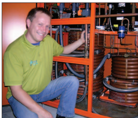
Børge har Menerga varmegjennvinner.

er, garderober og vestibyle, blir ventilert med resolair varmegjenvinner, som ikke trenger tilleggsvarme og har markedets høyeste gjenvinningsgrad. Dette sparer mye energi. For trimavdelingen er ventilasjonssystemet av typen Menerga Adsolair, dette gir meget behagelig klima og kjøler rommene ned etter naturens eget prinsipper, med et minimalt energiforbruk.